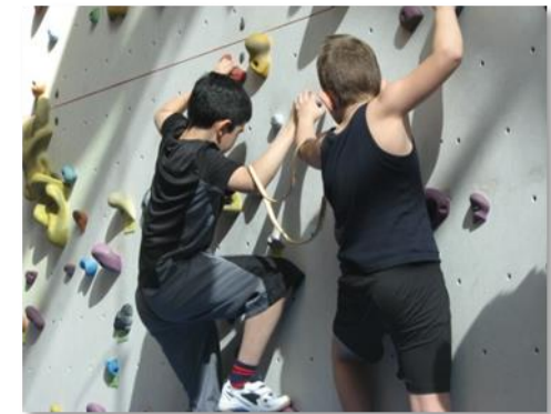
Klettern im FitKom *

2. Erwerb eigener Gelder zur Unterstützung schulischer Aktivitäten , die ohne die Mithilfe des Fördervereins nicht möglich wären.