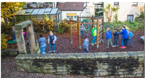
Trampolin und Klettergerüst Pausenhof Grundstufe *

Für 12 € oder einen frei gewählten Betrag können sie Mitglied werden. Folgende Beitrittserklärung ausfüllen und an Kirchstraße 79, 74354 Besigheim schicken